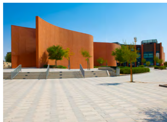
وكالة الإمارات للفضاء