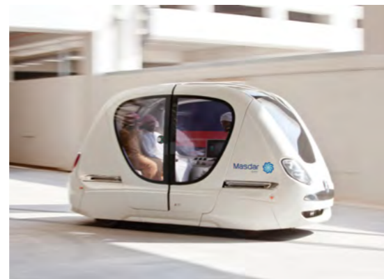
نظام النقل الشخصي السريع في مدينة مصدر