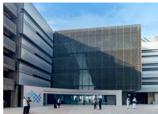
جامعة محمد بن زايد للذكاء الاصطناعي