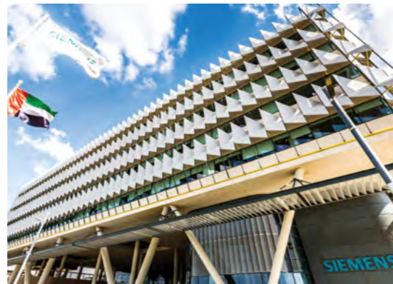
المقر الرئيسي لشركة سيمنز في الشرق الأوسط ضمن مدينة مصدر