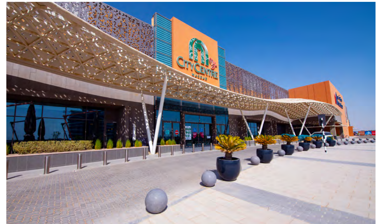
ماي سيتي سنتر مصدر

تم تصميم المساحات السكنية والتجارية والمؤسسية والترفيهية والمقاهي والمطاعم في المدينة لتقديم تجربة شاملة ضمن بيئة فريدة ملائمة للعيش والعمل والتعلم والترفيه.