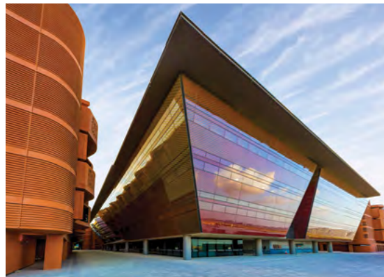
مبنى واحة الابتكار يضم النافذة الموحدة للخدمات في مدينة مصدر

يمكن لتجار التجزئة استئجار مساحات لمنافذ المأكولات والمشروبات والخدمات في جميع أنحاء مدينة مصدر.